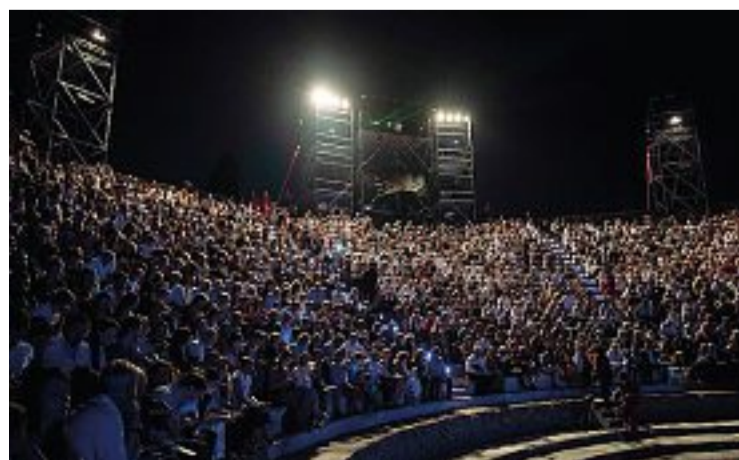
Allestimento Il teatro grande di Pompei

Direttore Teatro Stabile di Napoli - Teatro Nazionale