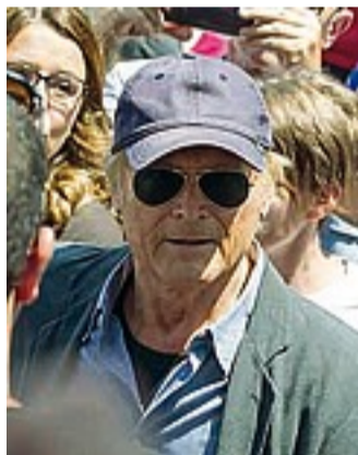
Terence Hill si fa largo tra la folla

F a caldissimo in piazza del Popolo. La chiesa degli Artisti si riempie in fretta e centinaia di persone restano fuori, sotto il sole bollente di mezzogiorno, per dare l'ultimo saluto al loro Bud Spencer. La folla è tale che quando arriva Terence Hill fa fatica a entrare. La gente gli dà pacche sulle spalle, gli stringe la mano, lo chiama Trinità. Lui ha gli occhi lucidi, la morte del suo amico lo ha scioccato: «Con Bud c'era la gioia e so già che quando ci rincontreremo le prime parole che mi dirà saranno "noi non abbiamo mai litigato!"», le parole pronunciate durante il funerale. Ci sono anche i fratelli Vanzina, Dario Argento, Massimo Ghini, Nicola Pietrangeli, Nino Benvenuti, Franco Nero, i