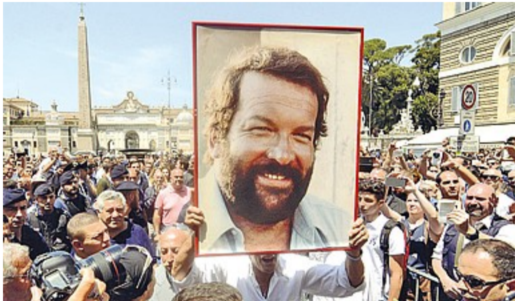
Tantissima gente ieri è rimasta ore sotto il sole davanti alla Chiesa degli Artisti di Roma per salutare Bud Spencer