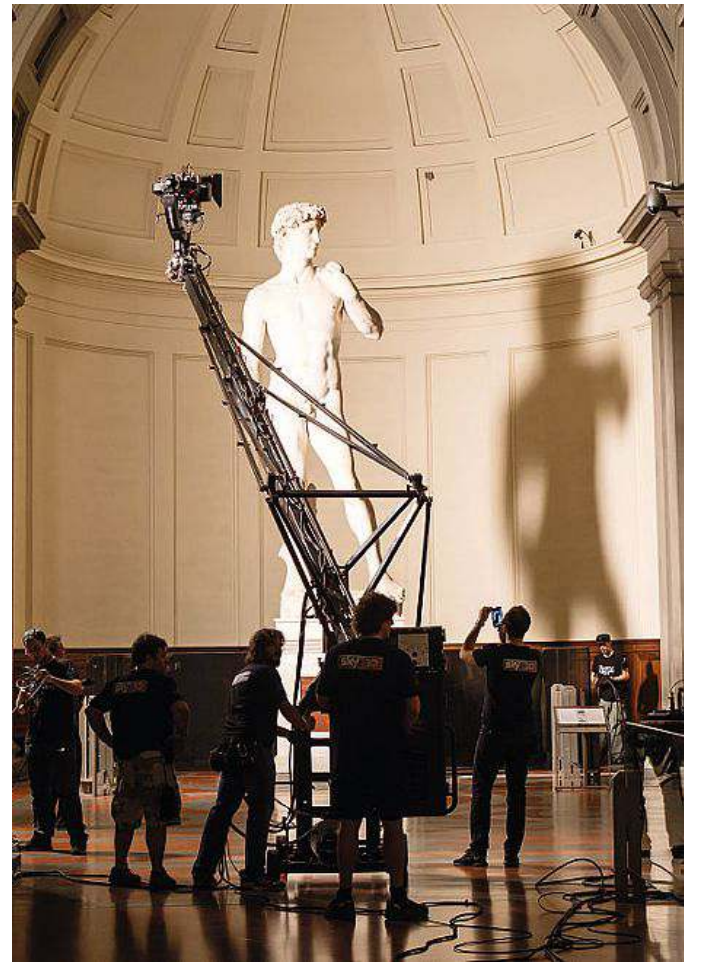
Un momento delle riprese del film con il David di Michelangelo

La maggior sorpresa la si ha quando le camere "esplorano" il David di Michelangelo rive-