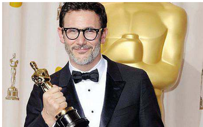
Il regista premio Oscar Michel Hazanavicius sarà a Firenze per France Odeon

In Toscana nei giorni 3,4,5, novembre nelle sale di Arezzo, Campi Bisenzio, Chiusi, Empoli, Firenze (4 sale), Grosseto, Impruneta, Livorno (2 sale), Lucca, Massa, Pisa, Pistoia, Poggibonsi, Prato, S. Casciano, Sesto Fiorentino, Sinalunga, Tavernelle, Viareggio e Volterra.