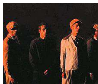
Un'immagine dello spettacolo