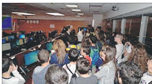
I ragazzi che hanno visitato il comando della squadra navale a Roma