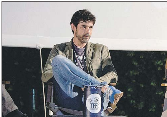
L'attore Alessandro Gassman protagonista del film che viene girato in questo periodo a Nepi

L'amministrazione comunale va dunque molto fiera di questa nuova risorsa, che, in