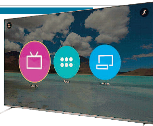
PANASONIC CX700 Lcd 4k con elettronica di alto livello. E smart tv Firefox Os