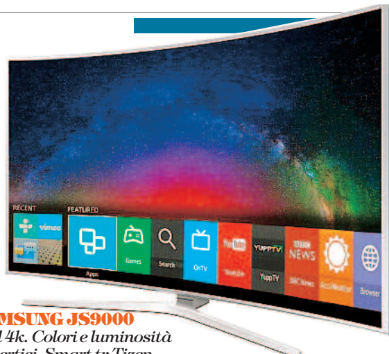
SAMSUNG JS9000 Lcd 4k. Colori e luminosità ai vertici. Smart tv Tizen

SBIT DOVES (per iPhone, iPad, Android e Windows Phone, 2,49 euro) Bella grafica retro (stile GameBoy) e struttura un po' snervante alla Flappy Bird. Per nostalgici